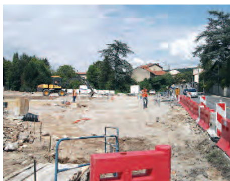
Aménagement du giratoire de la RD 386 et la rue Trénel - Juillet 2011

Le premier acte a consisté à réaliser un giratoire au débouché de la rue Trénel sur la RD 386 sur lequel viendrait se greffer la nouvelle rue des Petits Jardins, appelée à desservir le centre de secours du S.D.M.I.S. et les habitations à construire sur les terrains du Foussou et des Petits Jardins.