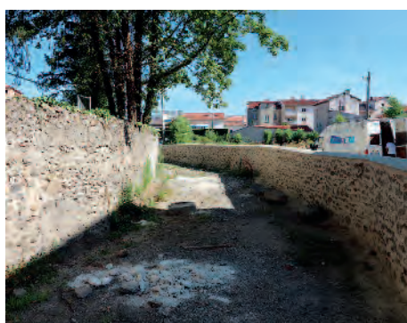
Chemin des Petits Jardins en cours d'aménagement