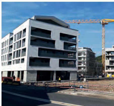
Création de la rue des Cerisiers

• L'aménagement du terrain du Fosso a commencé en mars 2017 : les derniers bâtiments encore debout ont été rasés pour permettre de disposer d'un espace à aménager.